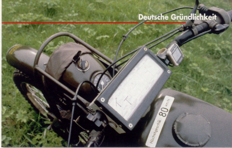
Global Positioning System. Soort van...

Hercules. Een zwart/witte. Daarvan staan er nu nog vijf in de container. Ooit reden deze motorrijtjes onder de gezegende billen van leden van de Johanniter Orde. Een soort zendingen- of rode-kruis-werk of zo.